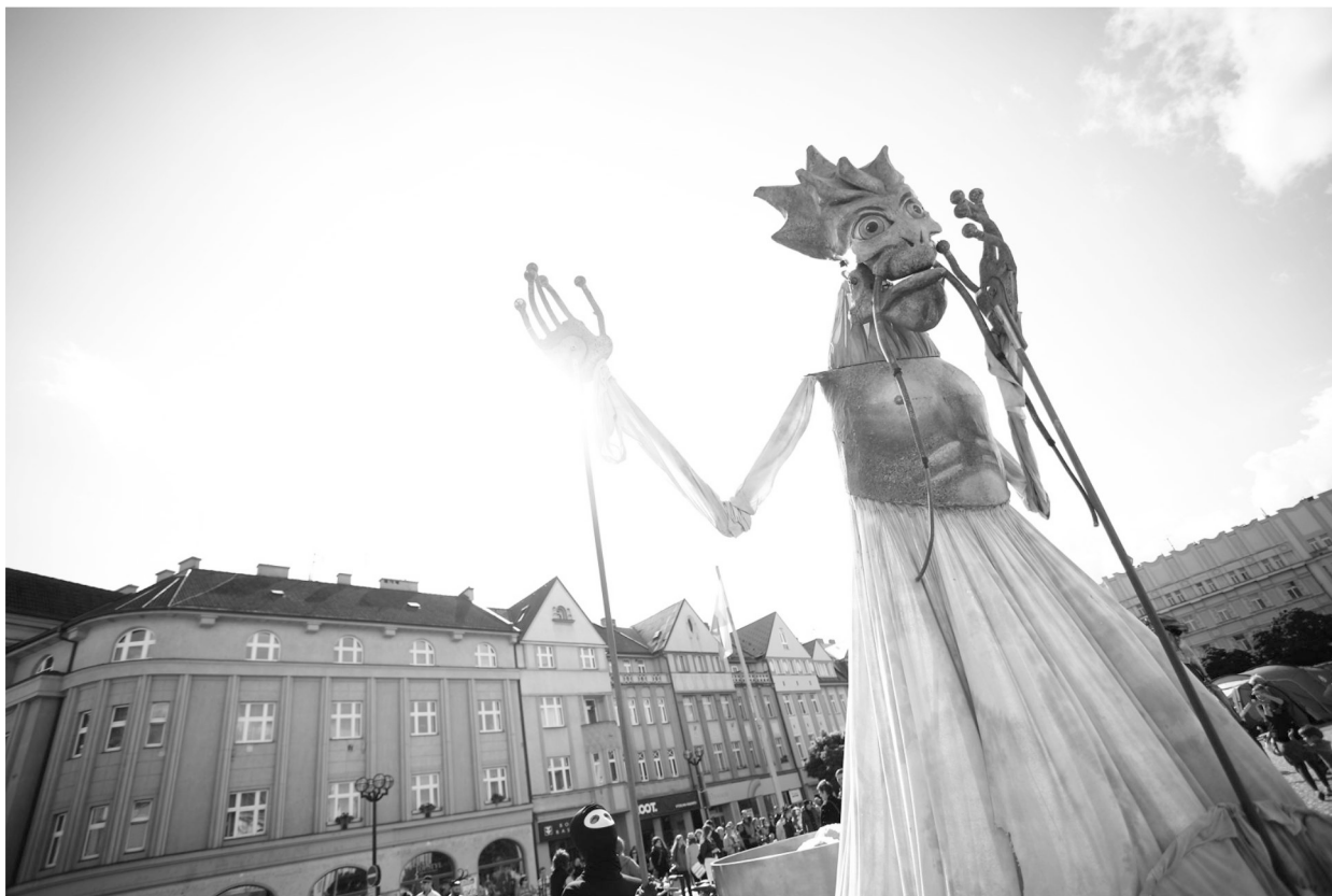
Šestnáctý ročník Open Air Programu Mezinárodního festivalu Divadlo evropských regionů Hradec Králové byl slavnostně zahájen průvodem z Masarykova náměstí do centra města. Procesí se neso v duchu tématu letošního ročníku, kterým je folklór.